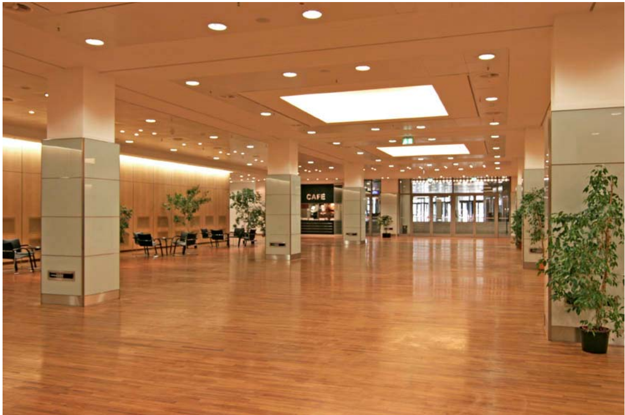
Teil des Foyers im Erdgeschoß

S. auch Plan am Ende dieser Hinweise und besuchen Sie http://www.cch.de/organisieren/raeumeundflaechen/ für einen virtuellen Rundgang des CCHs.